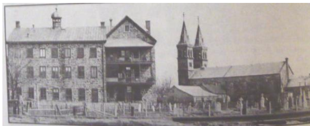
Photo prise au début du siècle, représentant l'Hospice Saint-Joseph de Beauharnois, vu de l'arrière.